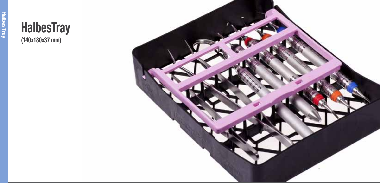
HalbesTray (140x180x37 mm)